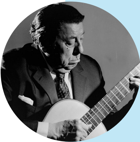
Atahualpa Yupanqui.