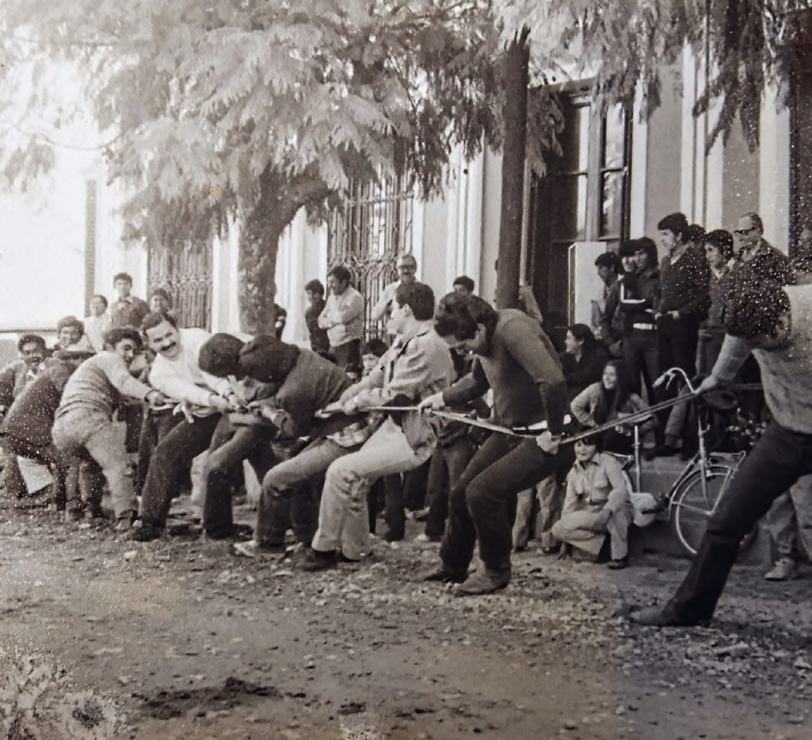
Cinchada en San Pedro de Colalao