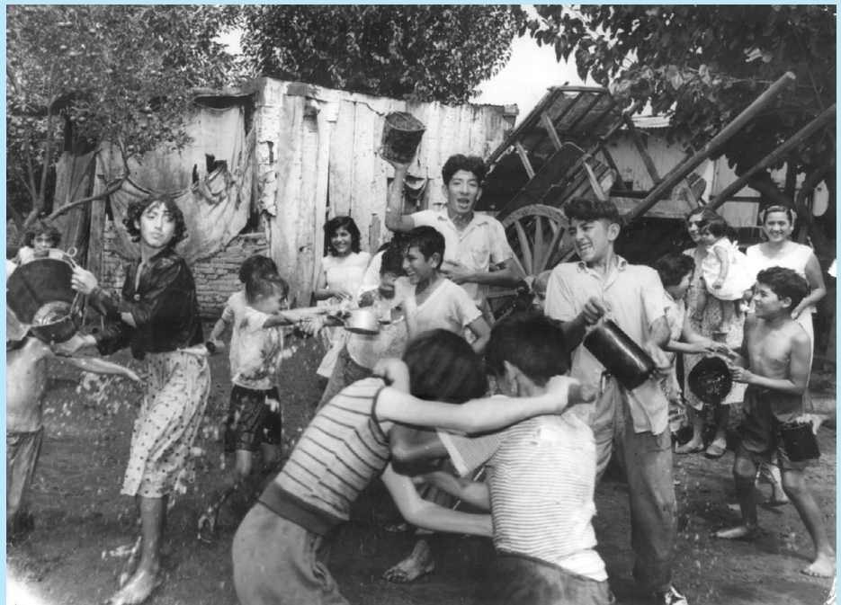
Imagen N° 1 Carnaval en Barrio Tucumano, La Gaceta