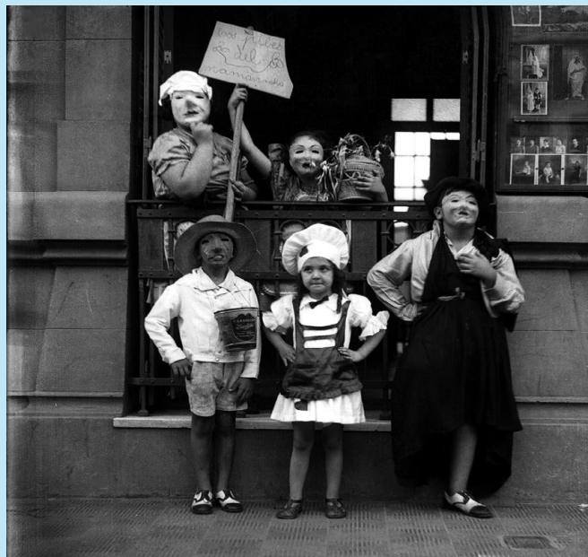
Imagen N° 2