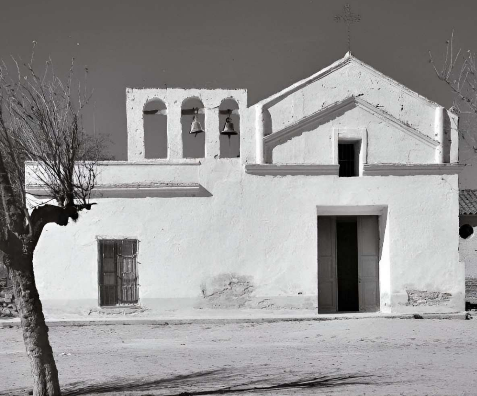
Foto: Iglesia del Sagrado Corazón de Hans Mann-ANBA Tomada de www.argentina.gob.ar