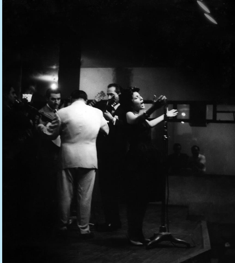
Mercedes Sosa en LV12

Como observamos, Mercedes Sosa cantando en la radio no solo registra un momento en la carrera de una gran artista, sino que también su presencia en medio de comunicación resalta el papel fundamental que jugó como productora cultural, utilizando su voz no solo para cantar, sino para comunicar mensajes profundos que resonaron a lo largo del tiempo y las fronteras.