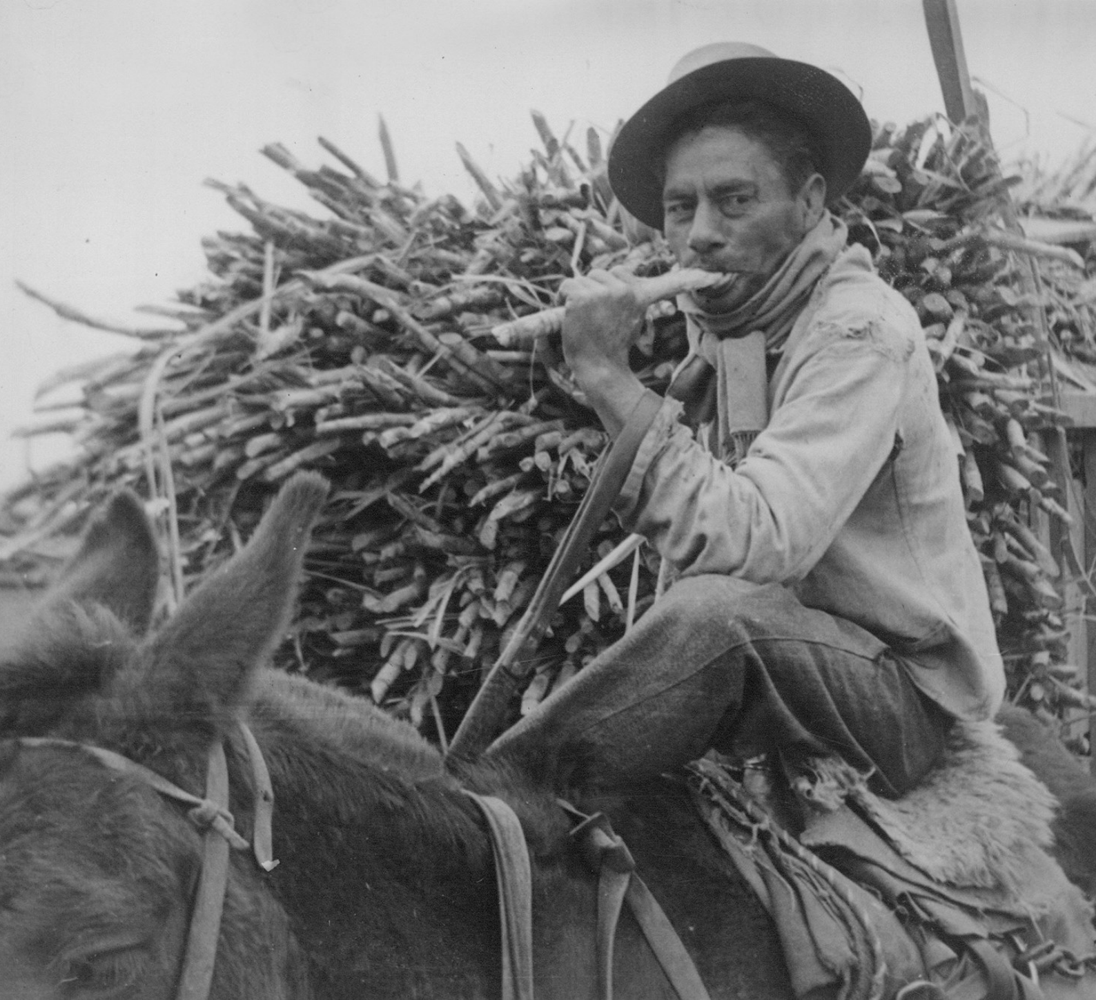
Foto: Paisano tucumano transportando la caña desde la cosecha al Ingenio. Tucumán, Ingenio Concepción 1948. AGN_DDF/ Caja 3035, inv: 175391.