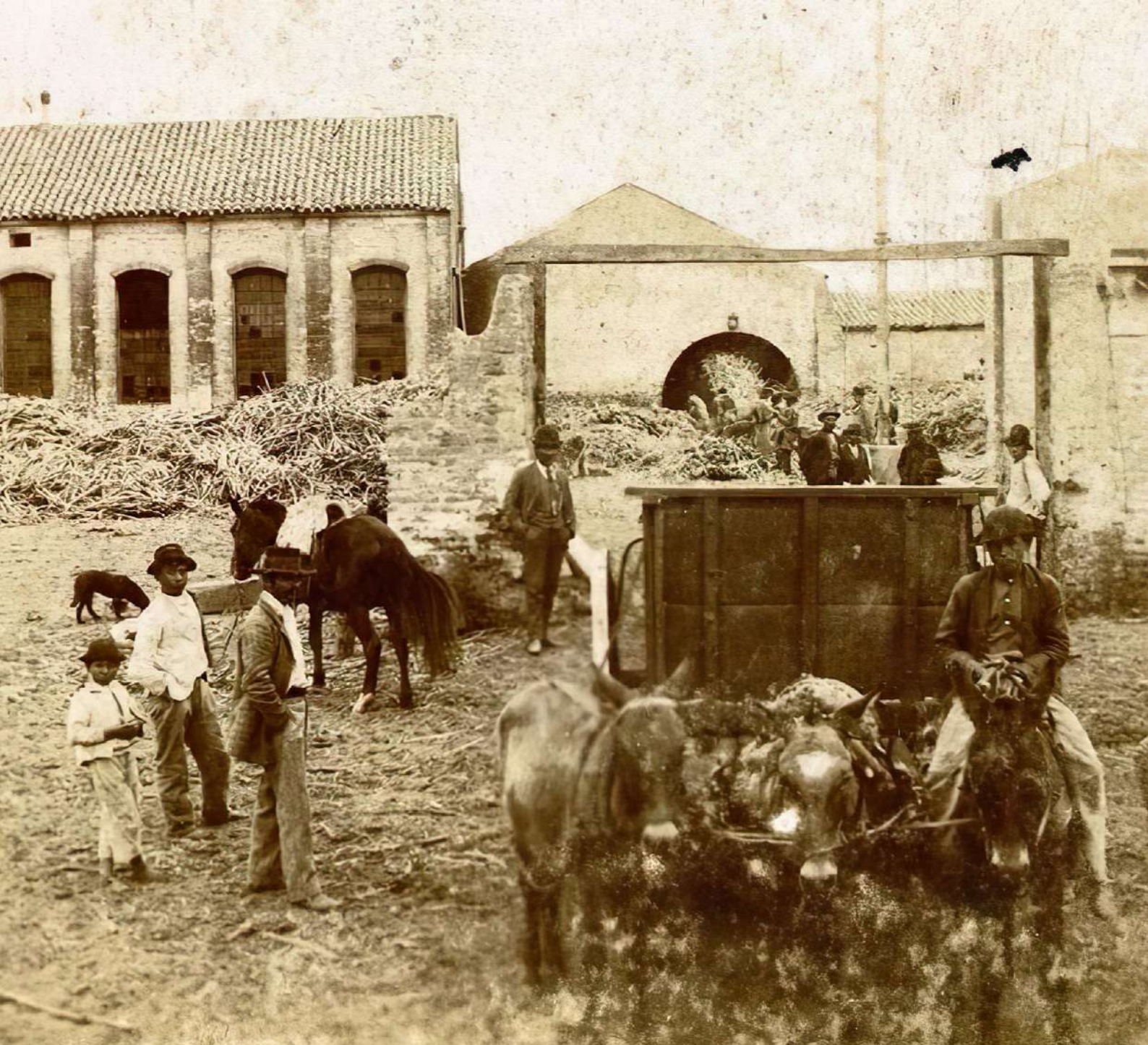
Trabajadores en un ingenio azucarero, fines del siglo XIX. Documento fotográfico. Album Aficionados. 216504.