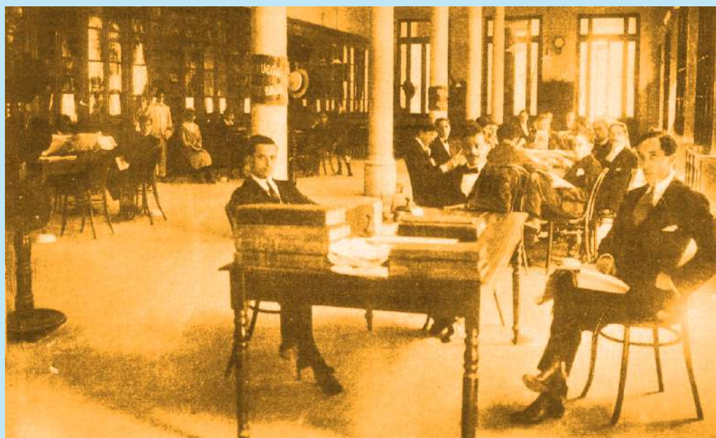
Sala de lectura en la Biblioteca de la Sociedad Sarmiento (1916)

Sobre la foto de la Biblioteca Sarmiento registrada en 1916, dialoguen: ¿Qué detalles observan en la imagen? ¿Pueden identificar mujeres en la foto? ¿Comparten la misma mesa con varones? ¿Qué cambios históricos o sociales podrían haber motivado la presencia de mujeres en la biblioteca?