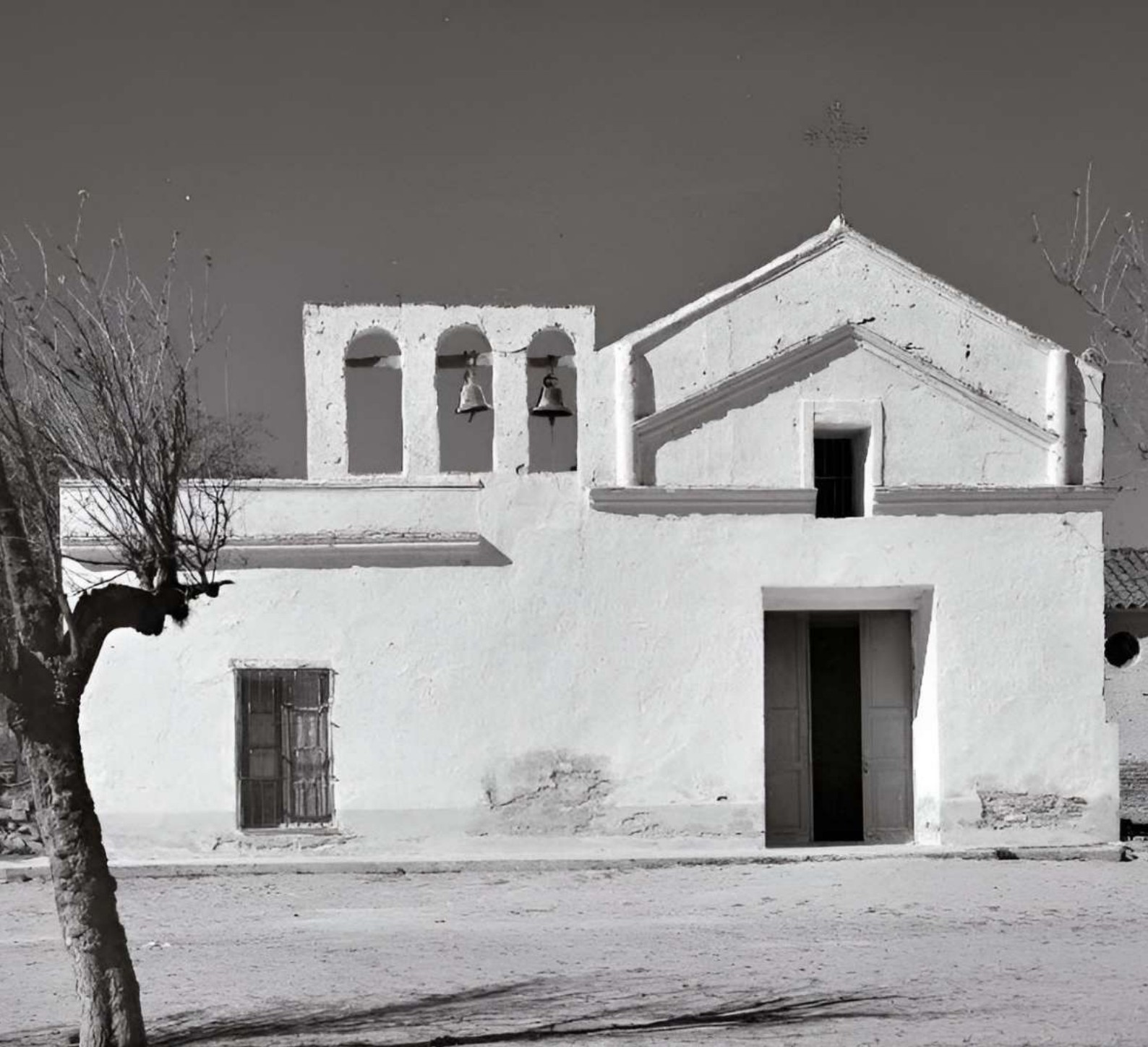
Foto: Iglesia del Sagrado Corazón de Hans Mann-ANBA Tomada de www.argentina.gob.ar